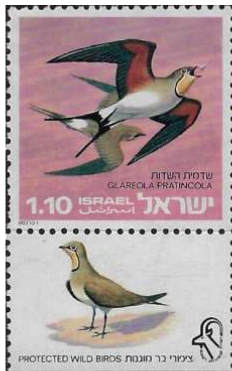
שדמית השדות Glareoia Pratincola