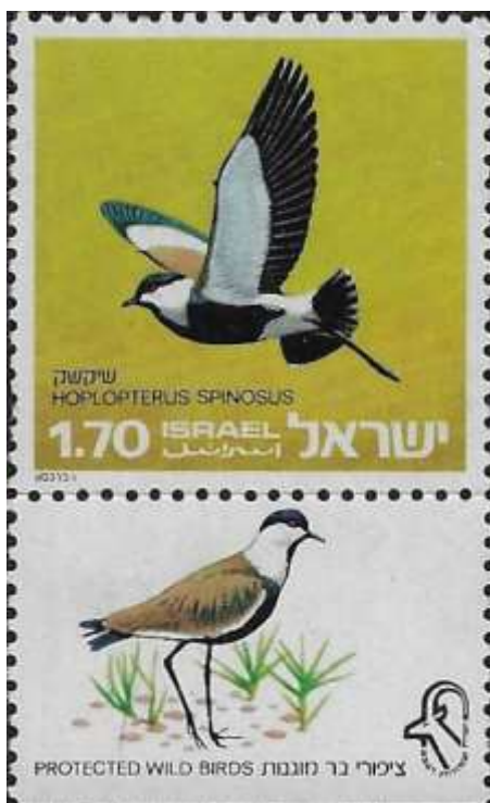
שיקשק Hoplopterus Spinosus