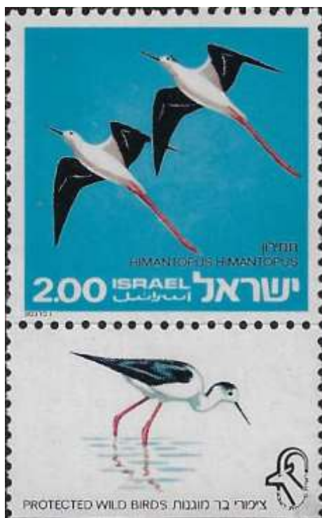
תמימון Himantopus Himantopus

שלושת בולי הסדרה הוקדשו לציפורי בר המשתייכים לסדרת החופמאים או דמויי חפמי. מרבית החפמיים בארץ הם עופות חורפיים או עוברי אורח בלבד, בסתוו ובאביב. מהם נדירים שבנדירים, ומהם כאלה שניתן אז לראותם בלהקות גדולות וצפופות. במשך הקיץ עפים רובם לקנן באירופה, שם ידגרו ויגדלו דור צאצאים חדש. בארץ נותרים אז 6 מינים בלבד הדוגרים כאן ומגדלים את צאצאיהם. גם מינים אלה אינם מונים אלא עשרות זוגות בלבד, וממינים אלו נבחרו הציפורים שהופיעו בבולים. שלושתם נכללים ב"רשימה האדומה" אשר בה מרוכזים אותם מינים שחלה ירידה משמעותית באוכלוסייתם.